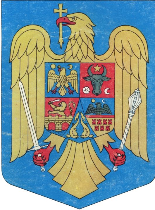
Stema României (1992–2016)