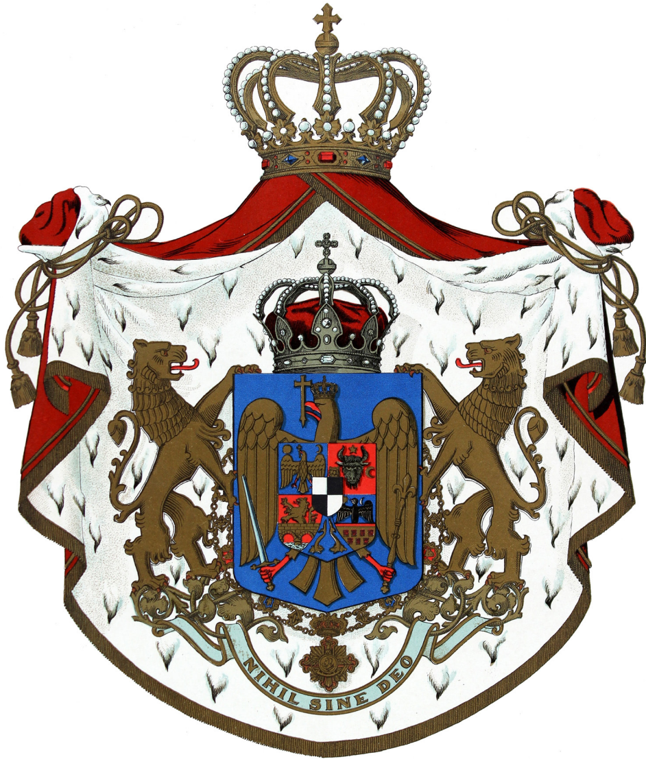
Stema mare a României de la 1921