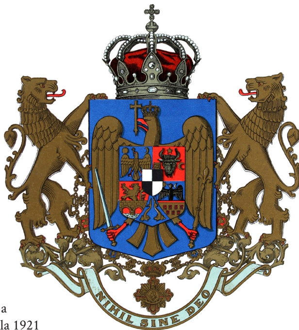
Stema medie a României de la 1921