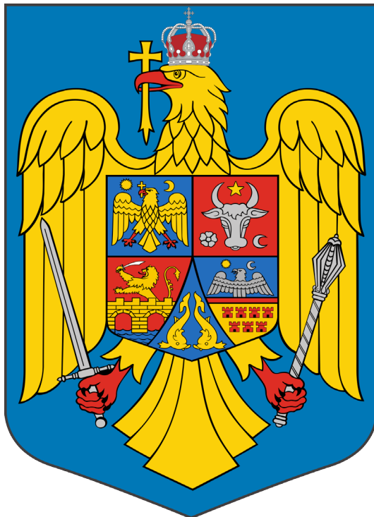
Stema României (2016–prezent)